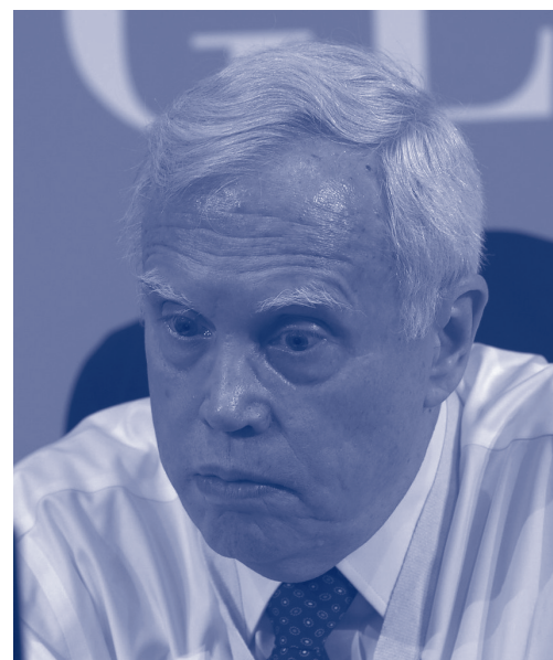
James J. Heckman

Dass sich Investitionen im Frühbereich lohnen, wusste nicht nur Churchill, sondern das wird mittlerweile durch viele Studien belegt. So etwa durch eine Arbeit des Nobelpreisträgers für Wirtschaft, J. J. Heckman 2) , der von einem Return of Investment von eins zu sieben spricht, wenn zugunsten kleiner Kinder von sozial benachteiligten Familien investiert wird. Es ist denn auch die OECD, welche der Entwicklung der frühen Förderung seit Jahren hohe Priorität einräumt, und deren Empfehlung «No child left behind» hat die Strategie in Basel-Stadt wesentlich mitgeprägt 3) . Die Thematik wurde neu auch von der Weltbank aufgenommen: Präsident Jim Yong Kim spricht sich für den Aufbau