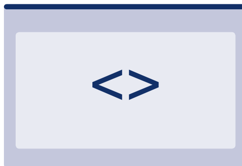
Emoticons charakterisieren sogar Persönlichkeiten des öffentlichen Lebens; die «Raute» steht für die deutsche Bundeskanzlerin Angela Merkel.

Mark Twain spottete einst, man solle Voraussagen unbedingt vermeiden, besonders solche über die Zukunft. Trotzdem lassen sich neun Megatrends erkennen, die unsere Sprache in der kommenden Generation beeinflussen werden.